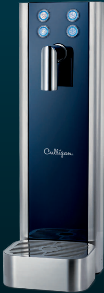
Glass Tower One